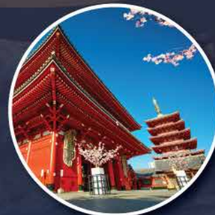
Asakusa Sensoji Temple

* Note: Keberangkatan bisa berubah \pm 1 - 2 hari dari waktu yang sudah ditentukan, mengikuti kebijakan maskapai