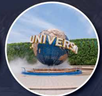
Universal Studio Japan